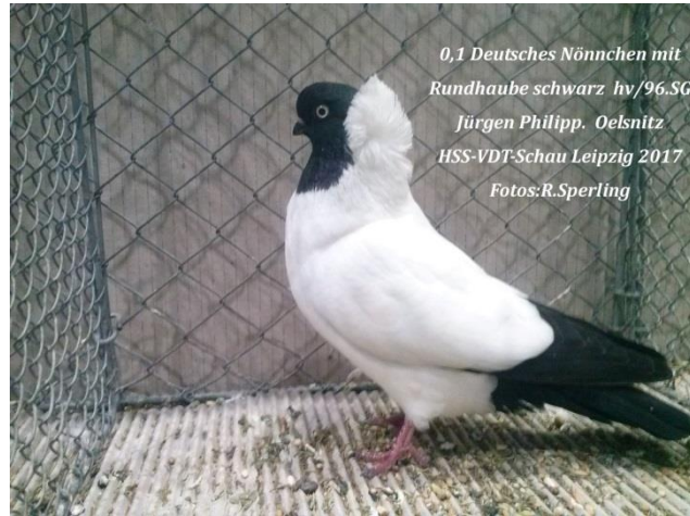
0,1 Deutsches Nönnchen mit Rundhaube schwarz hv/96.SG Jürgen Philipp. Oelsnitz HSS-VDT-Schau Leipzig 2017