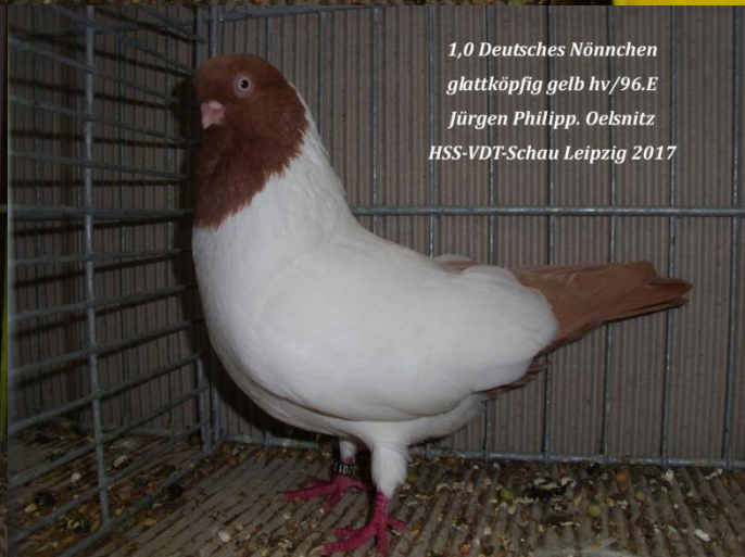
1,0 Deutsches Nönnchen glattköpfig gelb hv/96.E Jürgen Philipp. Oelsnitz HSS-VDT-Schau Leipzig 2017