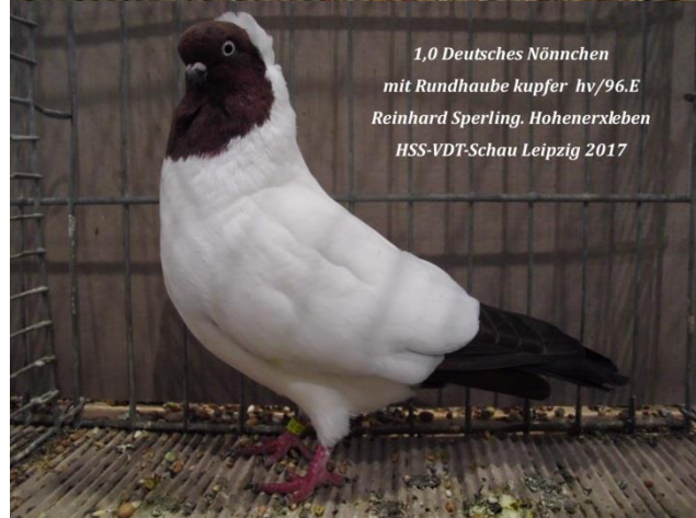
1,0 Deutsches Nönnchen mit Rundhaube kupfer hv/96.E Reinhard Sperling. Hohenerleben HSS-VDT-Schau Leipzig 2017