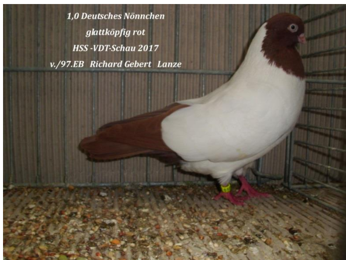
1,0 Deutsches Nönnchen glattköpfig rot HSS-VDT-Schau 2017 v./97.EB Richard Gebert Lanze