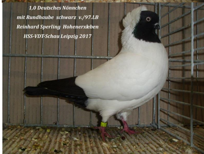
1,0 Deutsches Nönnchen mit Rundhaube schwarz v./97.LB Reinhard Sperling Hohenerxleben HSS-VDT-Schau Leipzig 2017