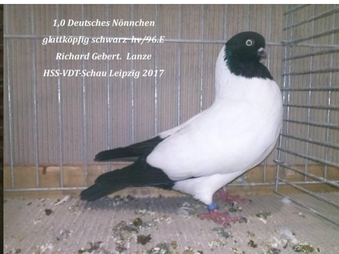
1,0 Deutsches Nönnchen glattköpfig schwarz hv/96.E Richard Gebert. Lanze HSS-VDT-Schau Leipzig 2017