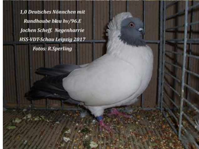
1,0 Deutsches Nönnchen mit Rundhaube blau hv/96.E Jochen Scheff. Negenharrie HSS-VDT-Schau Leipzig 2017