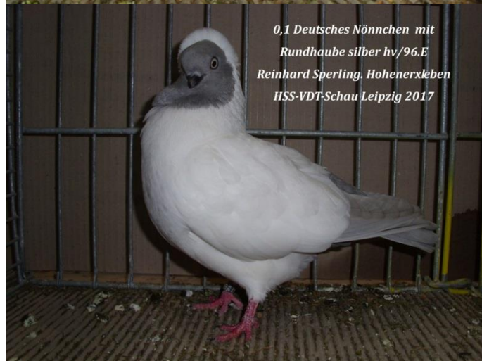
0,1 Deutsches Nönnchen mit Rundhaube silber hv/96.E Reinhard Sperling, Hohenerxleben HSS-VDT-Schau Leipzig 2017