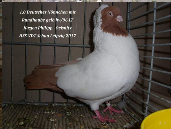
1,0 Deutsches Nönnchen mit Rundhaube gelb hv/96.LT Jürgen Philipp. Oelsnitz HSS-VDT-Schau Leipzig 2017