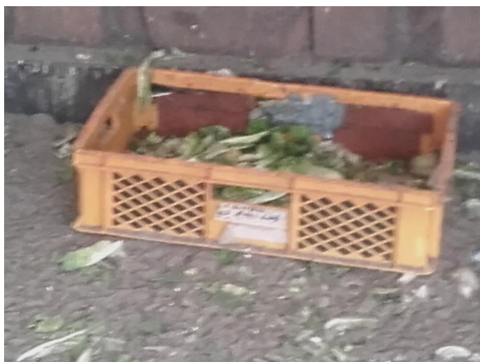
Salat für alle.