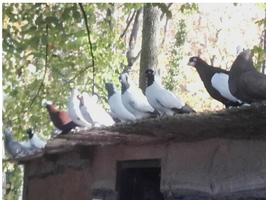
Der Freiflug wird genossen.