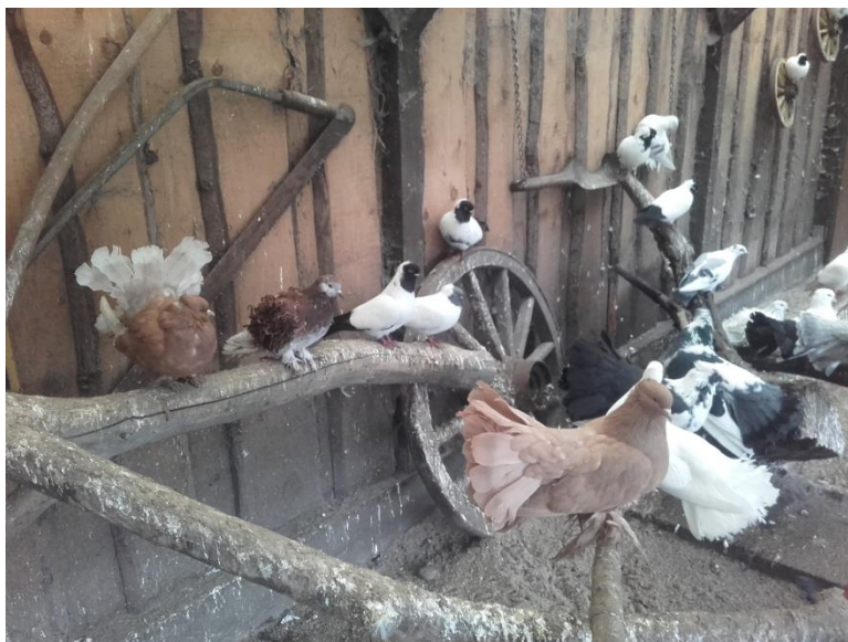
Tauben unter sich.